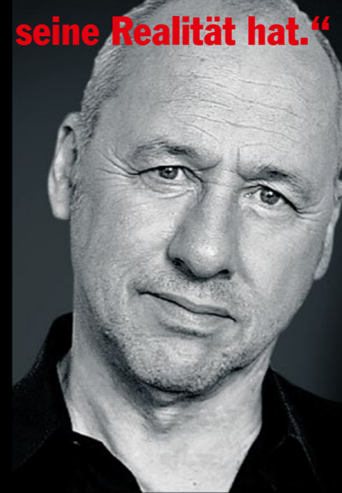
MARK KNOPFLER Mitgründer der Rockgruppe Dire Straits („Sultans of Swing“), zählt zu den weltbesten E-Gitarristen. Seit über zwanzig Jahren ist er erfolgreicher Solokünstler.

„Ich mag keine Definitionen – aber wenn es eine Definition von Freiheit gibt, wäre es der Zustand, in dem man die Kontrolle über seine Realität hat.“