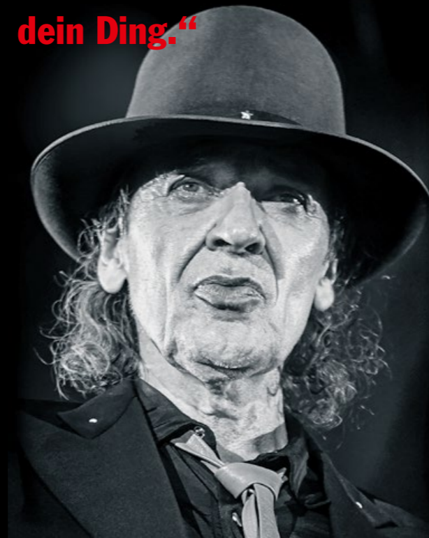
UDO LINDENBERG Rockmusiker, Schriftsteller und Kunstmaler. Anfang der 1970er-Jahre verhalf er der deutschsprachigen Rockmusik mit seinen unverwechselbaren Songtexten zum Durchbruch.

„Meine Vorbilder waren Daniel Düsentrieb, Marlon Brando und Hermann Hesse. Ansonsten gilt: Folge keinem Idol. Folge nur dir selbst und mach dein Ding.“