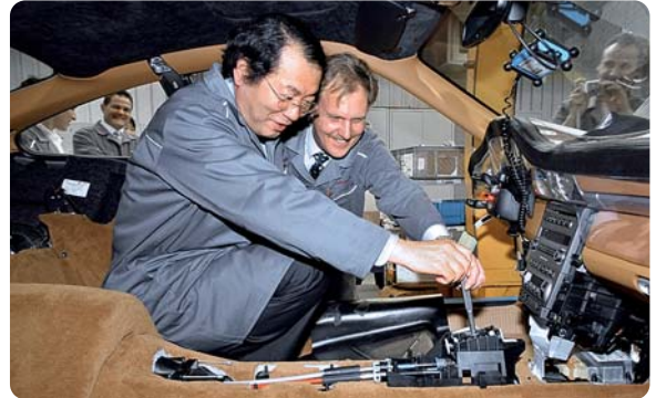
... und versuchte sich auch beim Inneneinbau

habe ich die analoge Arbeitsweise quasi in Vollendung kennen gelernt.“