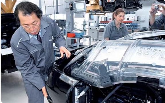
... Rundgang durch die Porsche-Produktion selbst Hand an ...