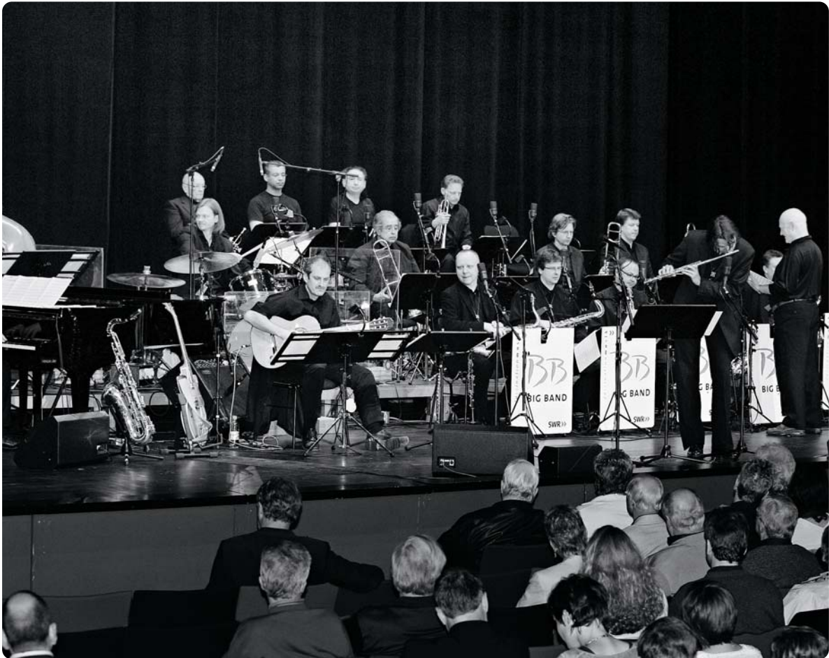
Lauschangriff: Don Menza (r.), Band und Solist bringen dem Publikum die Flötentöne bei

immer gleich an den Künstler, der dazu passt. Es folgen Gespräche mit dessen Management: Besteht Interesse, gibt es Termenschwierigkeiten? Um welche Art Musik geht es, wie soll sie klingen? Der ebenfalls ausgewählte Arrangeur formt Klangbilder, die elektronisch verschickt werden. Echte Profis können sich anhand von „Hörfetzen“ genau vorstellen, was am Ende dabei herauskommen soll, und sie wissen, was sie zu tun haben. „Der Vorlauf für eine Produktion kann sehr lang sein“, sagt