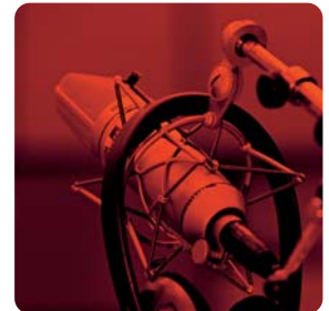
Momentaufnahmen aus dem Musikeralltag – mit Händen, Stöcken und jeder Menge Technik