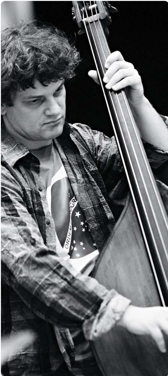
Immer locker bleiben: Der Mann am Bass