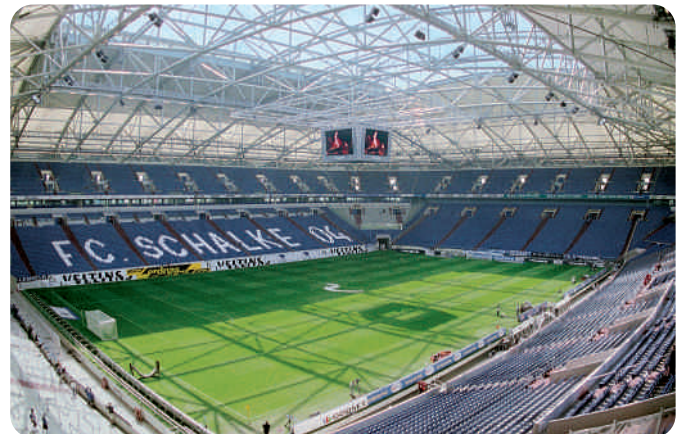
Produktvielfalt: Fischer findet man im Maybach (oben), in Kinderzimmern und in der Arena auf Schalke