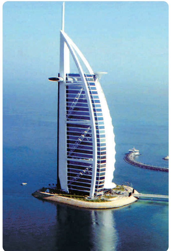
Fischer futuristisch: Traumhotel in Dubai