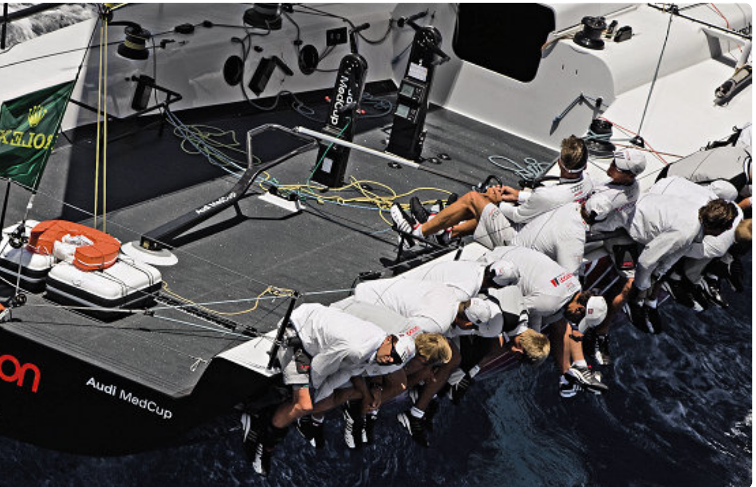
Harte Trainingseinheiten unter Wettbewerbsbedingungen: Die Segler des Team Germany halten sich im Audi MedCup fit